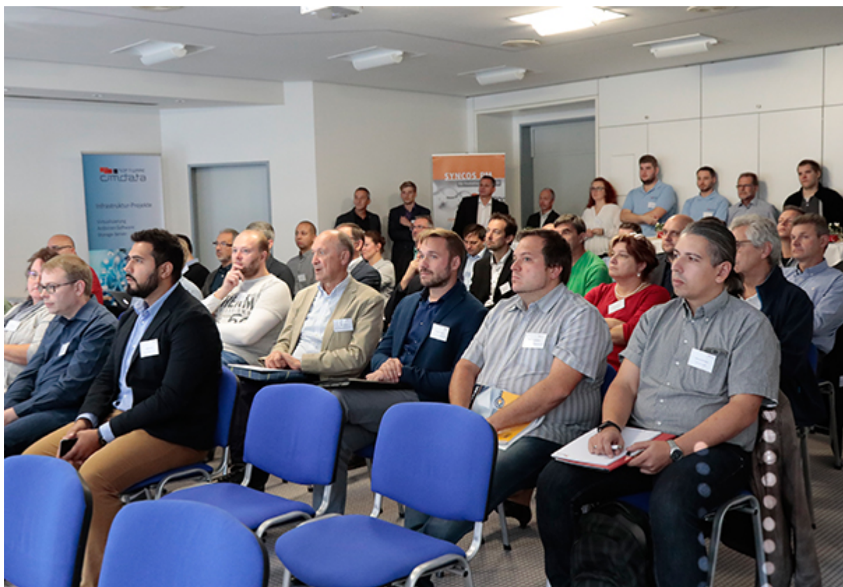
Informative Vorträge am IT Forum 2018