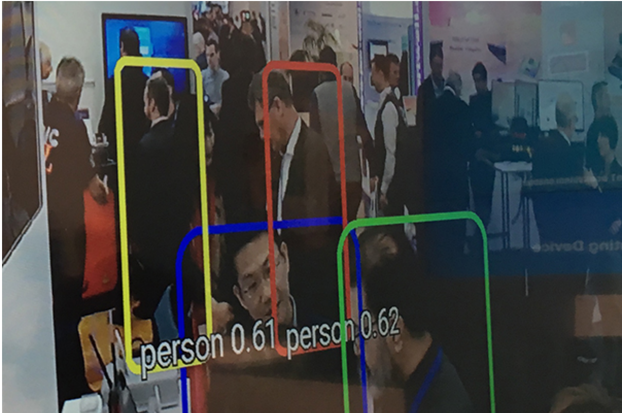
Gesichtserkennung mit Nutzung von KI

From: http://172.30.2.91/ - cimERP Online Hilfe