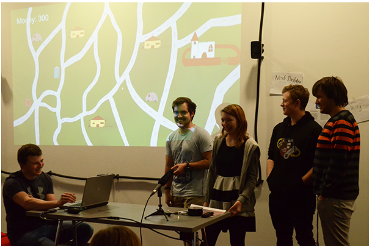
Präsentation der Spiele am GGJ