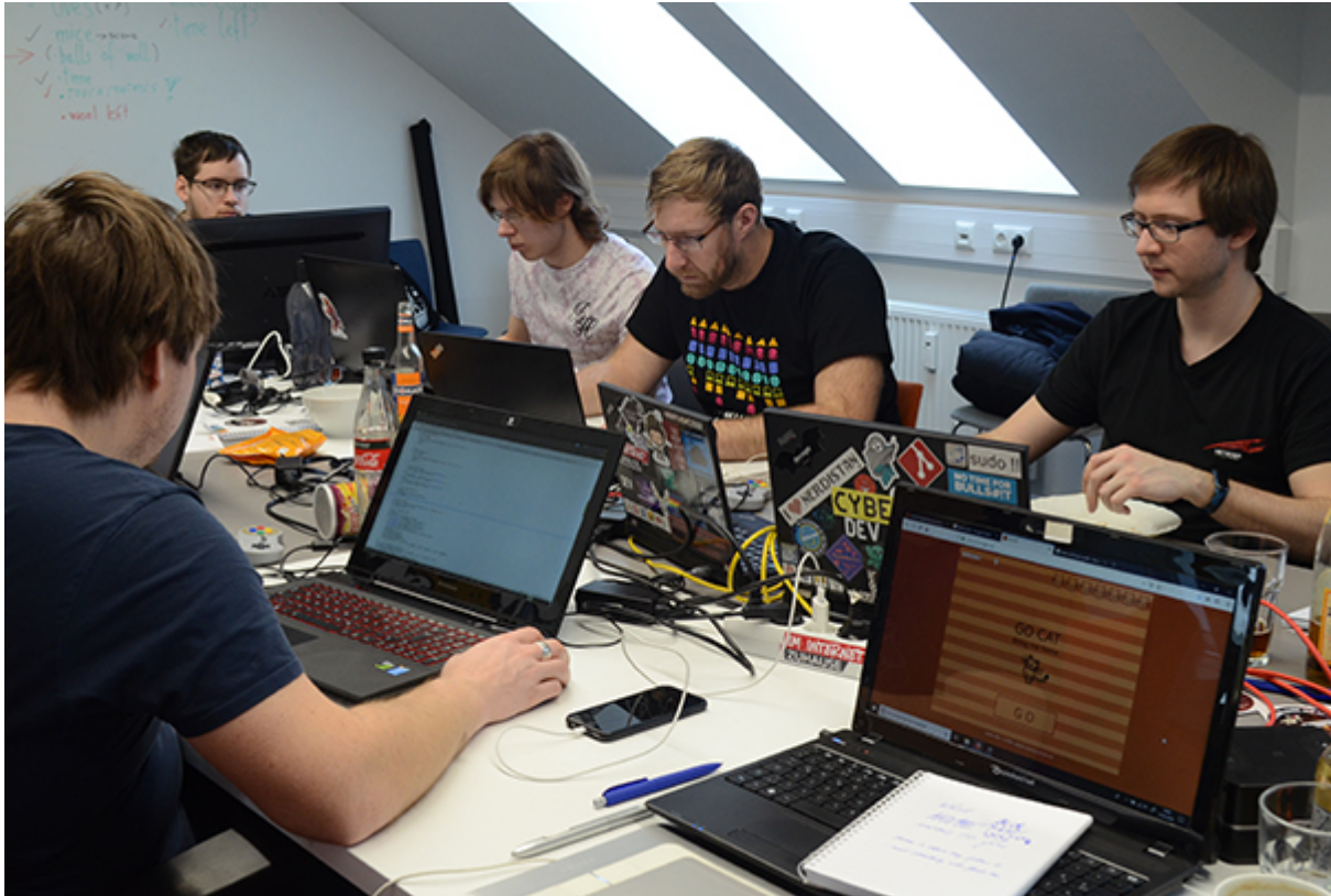
Programmieren im Team „Go Cat“