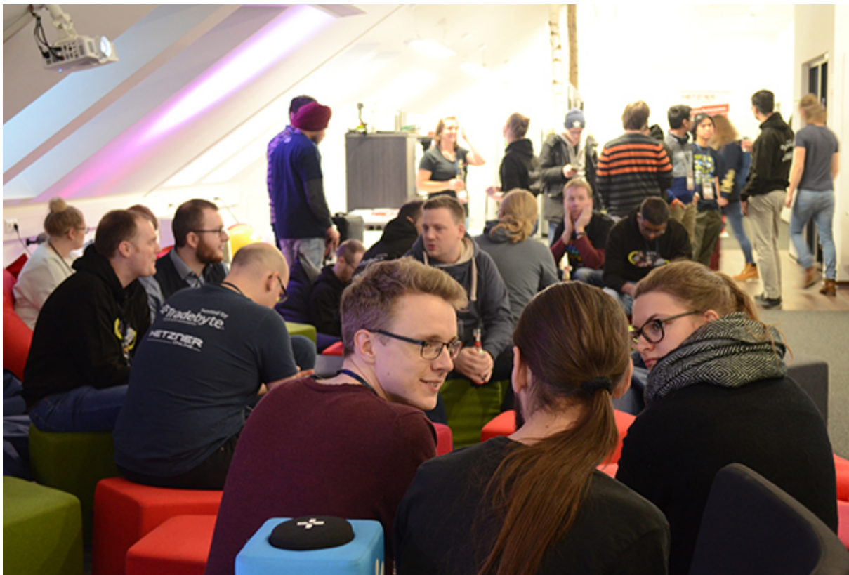
Ideensuche und Brainstorming am GGJ

Dieses Jahr fand wieder am letzten Januar-Wochenende vom 25.-27. 01.2019 der weltweite Global Game Jam (GGJ) statt. 47.000 Teilnehmer aus 113 Ländern versammelten sich an den Locations, um voneinander zu lernen, neueste Techniken auszuprobieren und Spaß zu haben. Wie schon im letzten Jahr waren auch Programmierer von cimdata zur Spieleentwicklung an der Location bei Tradebyte in Ansbach vertreten. Wir unterstützen die Veranstaltung auch als Mitsponsor. Dieses Jahr fanden sich in Ansbach 60 Programmierer, Designer, Spezialisten und Hobby-Tech-Begeisterte ein. Aus den Spiele-Ideen, die dort innerhalb einer halben Stunde per Brainstorming zum diesjährigen Motto entstanden, wurden 9 ganz unterschiedliche Spiele entwickelt.