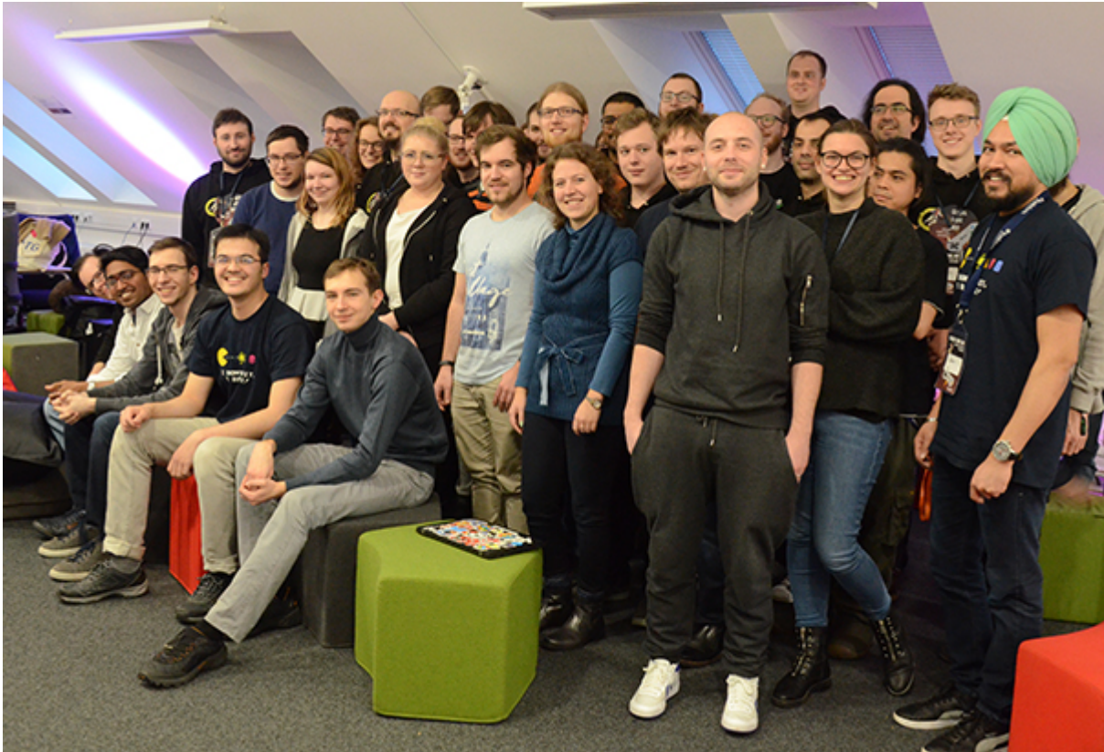
Teilnehmer des GGJ 2019 in Ansbach