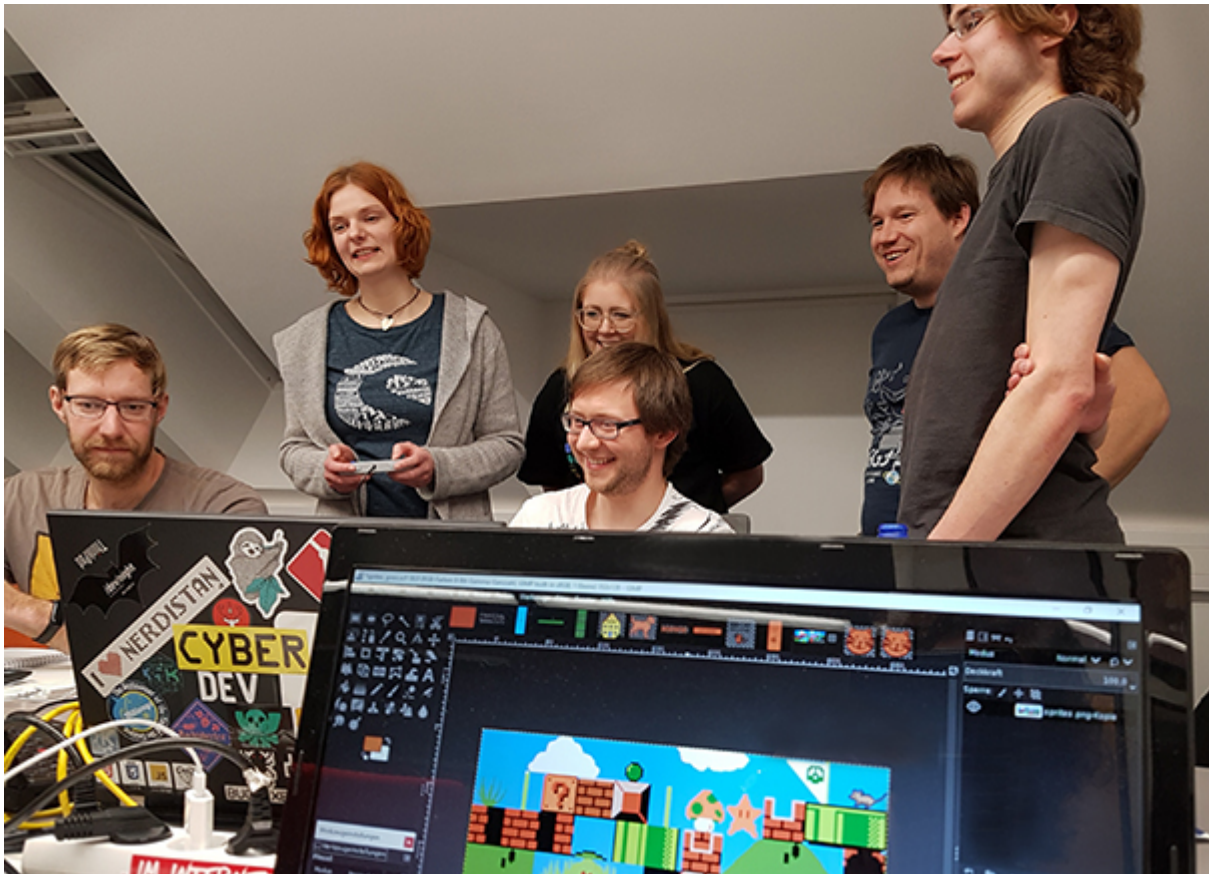
Spaß beim Testen des Spiels